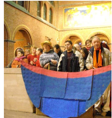
Des membres de L'Arche se présentent à la paroisse de Notre-Dame du Sacré Cœur