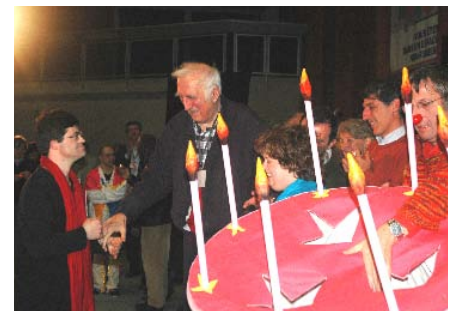
Surprise pour Jean Vanier : un gâteau un peu particulier pour marquer l'anniversaire des 45 ans de L'Arche !